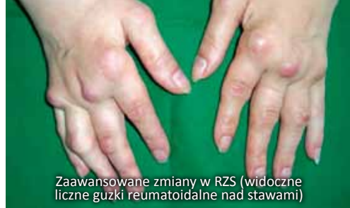
Zaawansowane zmiany w RZS (widoczne liczne guzki reumatoidalne nad stawami)